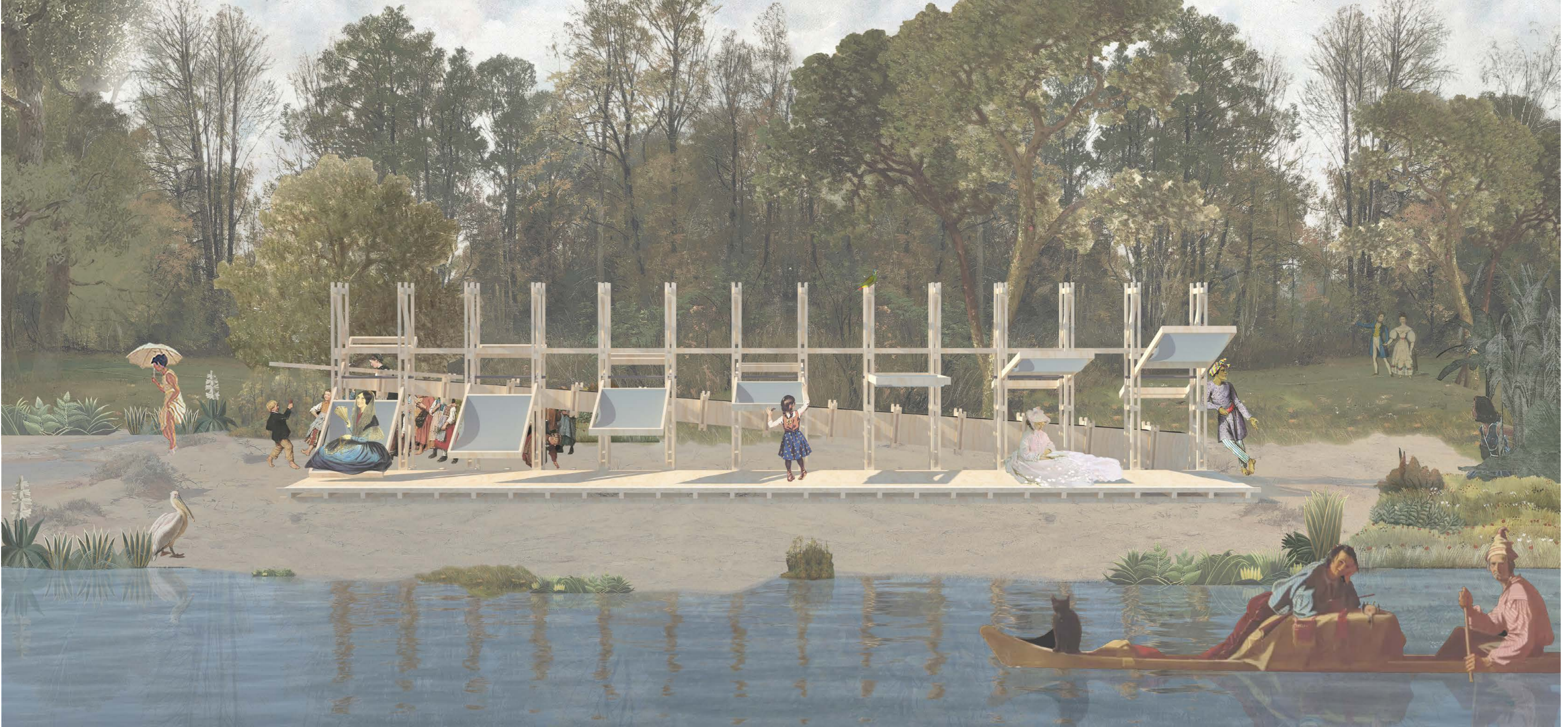
Depuis l'Allier Perspective générale