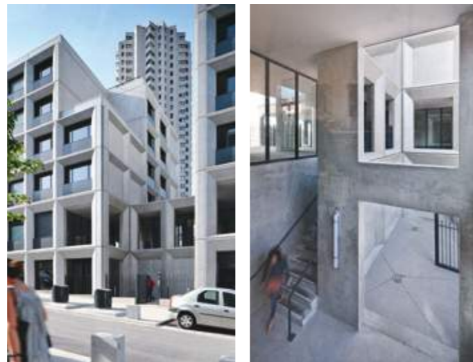
En haut : vue depuis l'avenue du Plateau. En bas gauche : vue de l'accès rue Françoise-Giroud. En bas droite : porche d'accès bas depuis l'accueil de la résidence universitaire.

Cette résidence, éditée sur le plateau du 9 e arrondissement de Lyon, s'inscrit dans le programme de reconstruction du quartier de La Duchère, débuté en 2003. Elle se compose de deux entités distinctes : d'une part, un bâtiment en long de quatre étages, comprenant une centaine de studios étudiants ; d'autre part, une petite tour de six étages, abritant une quarantaine de logements pour jeunes actifs, articulés autour d'un grand hall d'entrée traversant en double hauteur, reliant la rue Giroud en aval au cœur d'îlot. Les façades, constituées de panneaux préfabriqués en béton, traduisent à la fois l'expression du programme – de petites unités de logements formant une « ruche habitée » – et celle d'un mode constructif rationalisé et économique – des modules standards tantôt pleins, tantôt évidés. Plus encore que le soin apporté aux détails de mise en œuvre et à l'adaptation fine de l'ouvrage à la topographie, c'est le rapport à l'architecture moderniste de l'environnement qui interpelle, en particulier la filiation constructive et le lien mimétique qu'il parvient à établir avec l'éminente Tour panoramique qui le surplombe, un bâtiment -totem livré en 1972 par l'architecte François-Régis Cottin, labellisé Patrimoine du XX e siècle, et devenu véritable emblème du quartier.