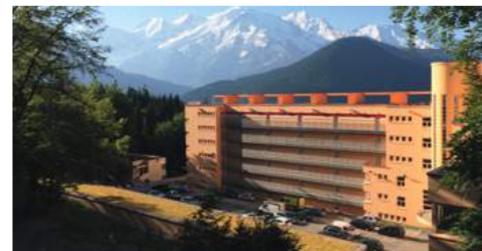
En haut : rénovation extérieure pour révéler les façades originelles. En bas : création de boxes avec toiture végétalisée s'insérant dans le paysage.