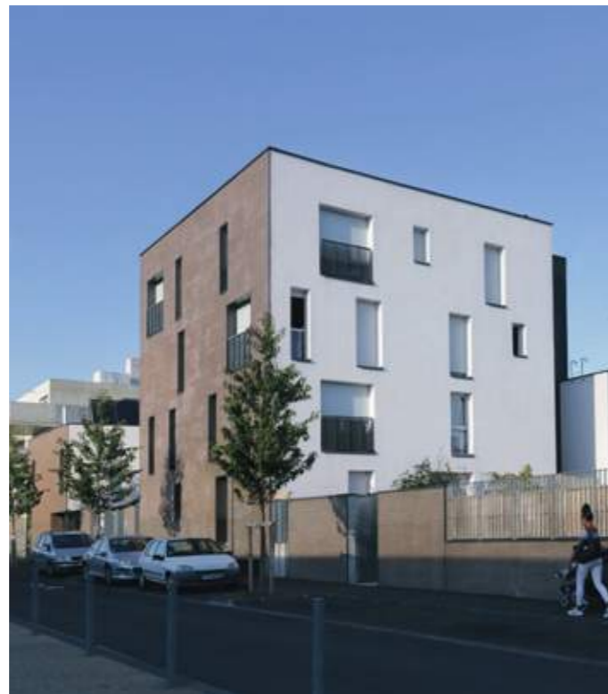
Côté rue, les façades sont revêtues de plaquettes de briques pour unifier l'aspect extérieur de l'ensemble et créer un contraste avec la végétation et les façades immaculées du cœur d'îlot.