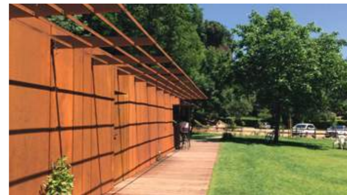
En haut : S'appuyant sur la topographie naturelle, le bâtiment d'accueil est logé dans un talus existant entre la voie de desserte et la prairie. En bas : l'assise est renforcée par une terrasse permettant la circulation de personnes à mobilité réduite.