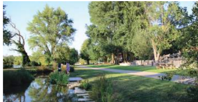
En haut : face aux berges, un amphithéâtre de plein air suit la pente naturelle du terrain. En bas : une noue plantée le long d'un cheminement.