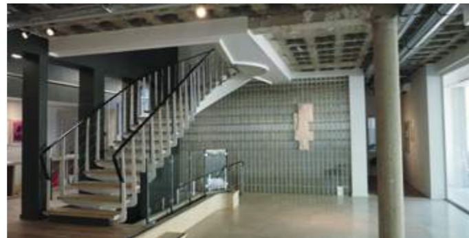
En haut : l'ancienne Chambre d'agriculture accueille aujourd'hui une galerie d'art sur trois niveaux. En bas : entièrement réaménagés, les espaces intérieurs gardent un esprit année 1960.