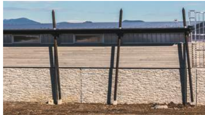
En haut: vue depuis la cour vers les travées de garages et l'administration. En bas: vue sur l'arrière des garages, le mur périphérique et le paysage lointain.