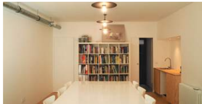
En haut: le jardin d'hiver, avec ses murs bruts et son sol en béton poli, vu depuis l'espace de travail. En bas: l'espace de travail, neutre et multifonctionnel.