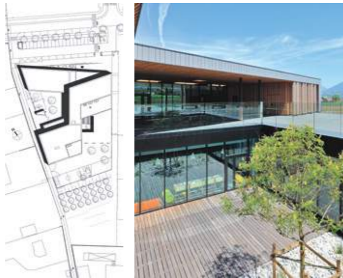
En haut : entrée de l'école. En bas gauche : plan de masse. En bas droite : vue du patio et de la terrasse.

Afin d'accueillir sa population scolaire toujours plus nombreuse, la commune de Reignier-Ésery a choisi un site proche du centre-bourg, en bordure d'une vaste plaine agricole. Le programme du nouveau groupe scolaire s'est avéré d'une réalisation complexe, tant dans son articulation avec le site, en pente, qu'en matière d'orientation et de gestion du vent dominant. En tenant compte de ces paramètres, il a fallu en effet installer et organiser, sur 2 650 mètres carrés de plancher, un groupe scolaire de dix classes, des espaces périscolaires, une salle d'évolution, une salle à manger avec office en liaison froide, plus deux cours autonomes. Le parti pris des architectes du cabinet grenoblois Composite a consisté à optimiser la forme de la parcelle pour ouvrir au mieux les espaces et offrir des accès de plain-pied aux différents cycles et ensembles fonctionnels. La géométrie, dépliée à l'instar d'un boomerang sur un rez-de-chaussée plus un niveau, libère et qualifie les espaces tout en les baignant de lumière naturelle.