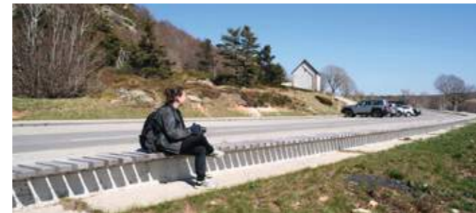
En haut : la maison de site présente un intérieur contemporain avec un cadrage sur le suc. En bas : l'assise linéaire invite à la lecture panoramique du paysage montagnard.