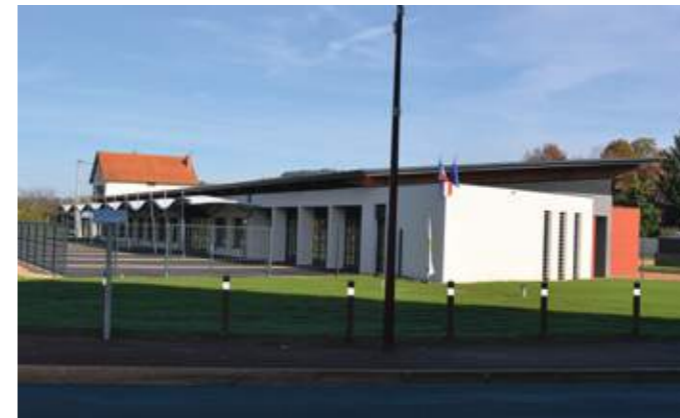
En haut: vue sur la façade sud-est. En bas: vue depuis l'entrée d'Estivareilles. L'espace végétal sera prochainement planté pour protéger visuellement la cour.