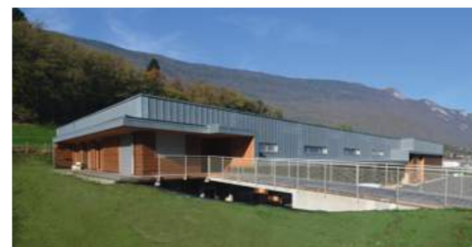
En haut: les bureaux sont protégés d'un trop fort ensoleillement par une large casquette en zinc et bois. En bas: angle sud-est, façade principale en bois et zinc.