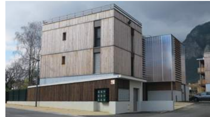
En haut : vue depuis la rue voisine. En bas : la décomposition en plusieurs volumes permet une meilleure intégration à l'échelle du quartier.