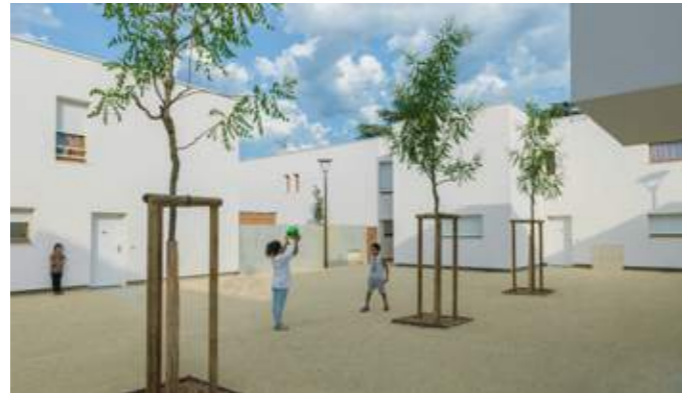
En haut : les différents volumes sont reliés par un tissu viaire paysagé principalement dédié aux déplacements doux. En bas : bien gérée, la densité a permis la création d'espaces publics à l'échelle de l'îlot.