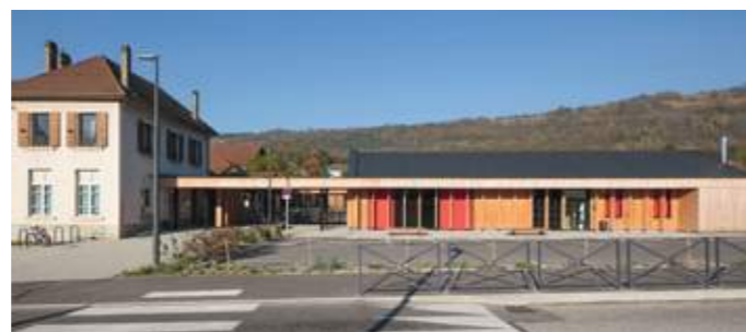
En haut : vue de la cour et du préau de l'école maternelle. En bas : vue de la crèche depuis l'avenue principale.