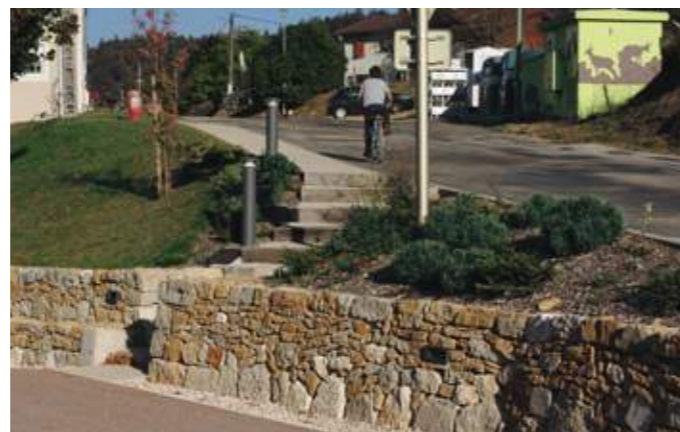
En haut : dans la pente, le tilleul surplombe le parvis de la mairie. En bas : au premier plan, le mur en pierres sèches.