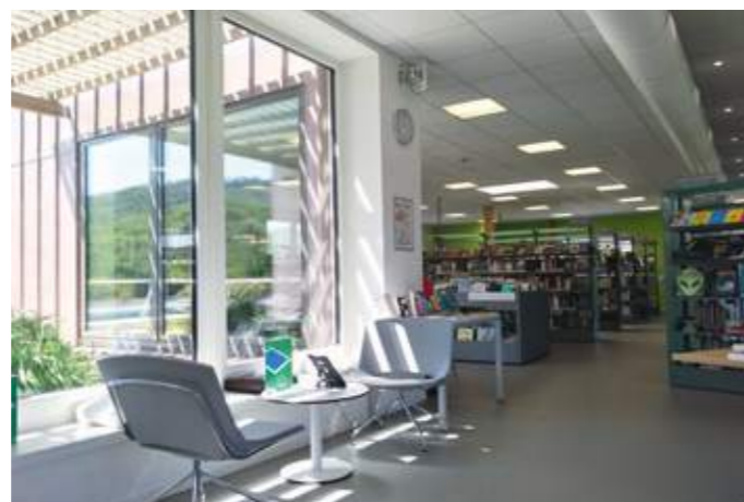
En haut: la construction de cette médiathèque est le point de départ du renouveau de tout un quartier. En bas: des patios plantés conduisent la lumière naturelle au cœur du bâtiment.