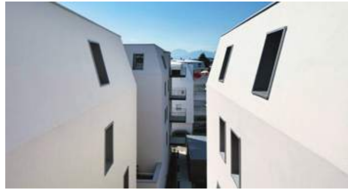
En haut : vue des façades à l'angle nord-est. En bas : interprétation contemporaine des toitures traditionnelles à la Mansart.