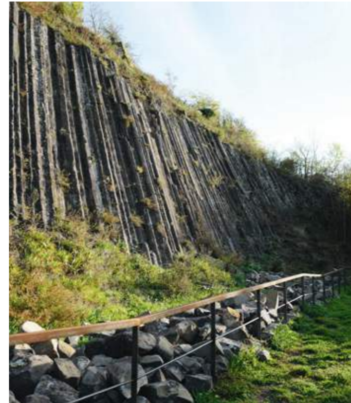
Valorisation du patrimoine naturel; les orgues basaltiques de la butte sont révélées et soulignées par la création d'un pierrier protégé par un garde-corps.