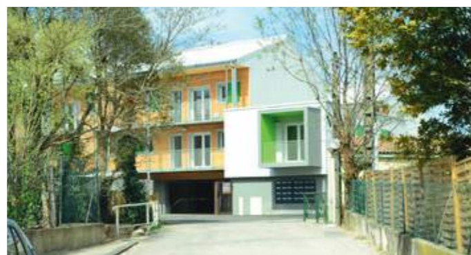
En haut : les façades sud en bois sont dotées de balcons filants. En bas : les cinq bâtiments sont desservis par une allée qui longe les jardins communs.