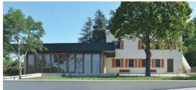
En haut: le projet se compose de jeux de volumes marqués, entre réhabilitation et extension. En bas: l'écriture contemporaine accompagne le bâti rénové dans un cadre de vie repensé largement.