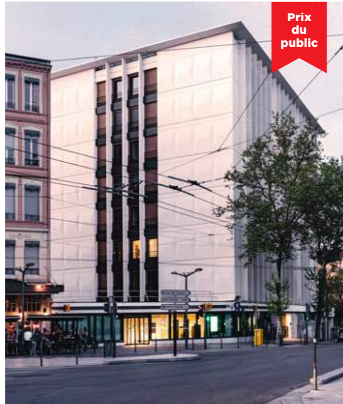
Vue de la façade ouest depuis le boulevard de la Croix-Rousse.