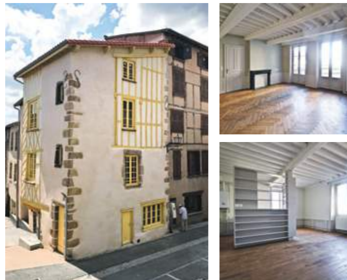
En haut et en bas gauche : façades principales rénovées des immeubles des 19, 21, 23 rue Mercière. En bas droite : intérieurs rénovés.

La réhabilitation de l'îlot Mercière est inscrite dans la reconquête du bâti ancien du Plan de Sauvegarde et de Mise en Valeur de la ville de Thiers. L'enjeu est de reconquérir des immeubles insalubres, en secteur sauvegardé, en proposant une offre locative confortable tout en préservant leur caractère patrimonial. Ce projet portait sur la requalification de trois petits immeubles devant accueillir sept logements. L'intervention consiste à optimiser la « réutilisation » tout en révélant des savoir-faire anciens de qualité. Les composants remarquables sont protégés, déposés, replacés, pour y associer ponctuellement des éléments de consolidation et d'optimisation des performances. Le projet, contemporain, conserve aussi les caractéristiques du lieu, témoins d'anciennes typologies d'ateliers et de logements des couteliers thiernois d'autrefois. Dans tous les appartements, les nouvelles affectations s'intègrent aux cloisonnements présents, traduisant de généreux espaces baignés de lumière. L'architecte intervient comme « un passeur de temps » dans cette transmission, qui s'appréhende au préalable par la reconnaissance approfondie d'un existant, abandonnant la démolition à sa stricte nécessité pour affirmer la reconnaissance d'un héritage oublié.