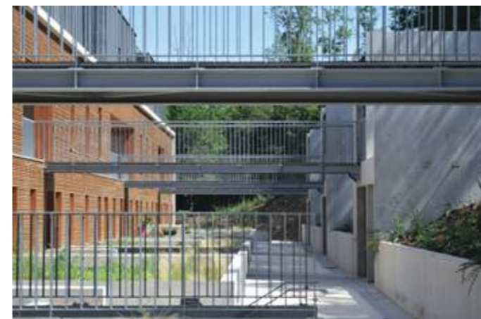
En haut : vue depuis la colline. En bas : les passerelles rythment l'allée intérieure.