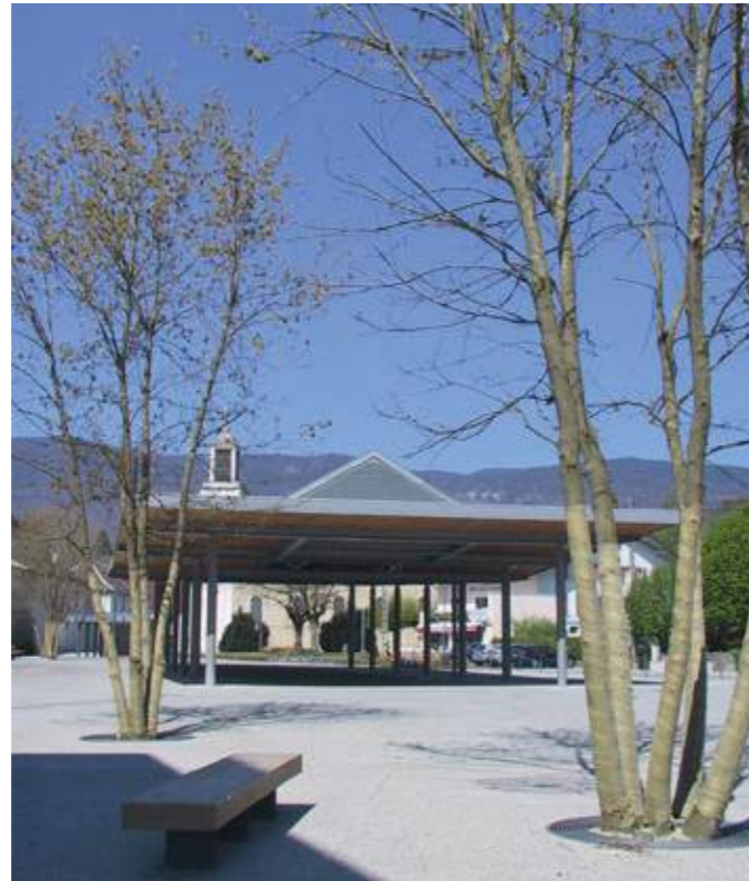
Structure légère en acier, offrant un impact au sol limité.