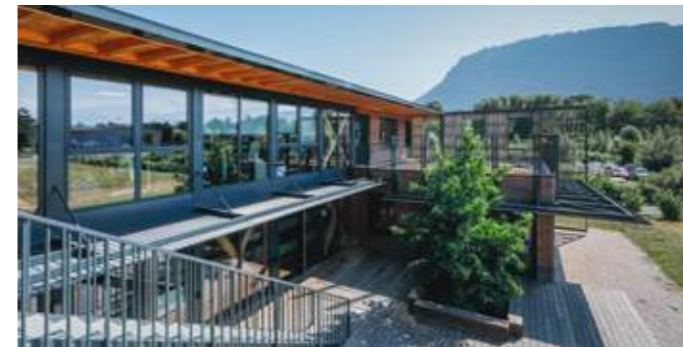
En haut: la terrasse sud est couverte d'une pergola pour offrir un espace agréable l'été. En bas: de larges baies vitrées et un grand débord de toit s'ouvrent sur le paysage.