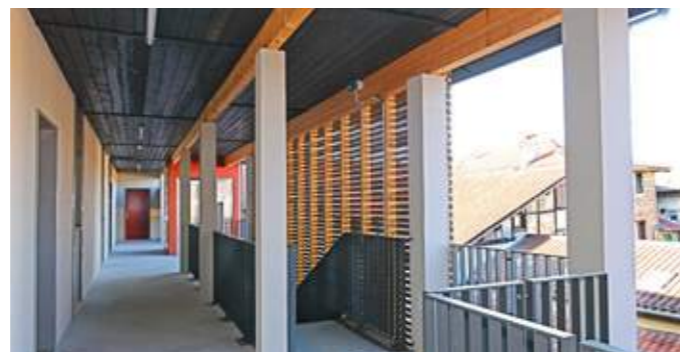
En haut : à l'angle de la rue, l'immeuble est composé de commerces à rez-de-chaussée. En bas : coursive en structure mixte bois et béton.