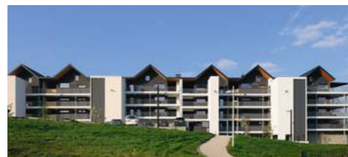
Le projet est une réécriture contemporaine des constructions massives traditionnelles de montagne, avec leurs toits à deux pans en débord et leurs murs épais.