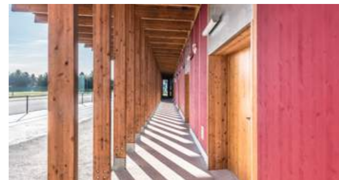
En haut : façade principale le long de la piste. Au milieu et en bas : abrités des intempéries par les portiques en lamellé-croisé de douglas, les panneaux de mélèze de la façade exposée est restent apparents.

Conçu comme une halle en bois, l'équipement sportif du stade d'athlétisme de la Communauté d'Agglomération du Bassin d'Aurillac comprend des vestiaires, un local pour le matériel sportif, des bureaux et un espace d'échauffement pour les coureurs. Composé de portiques resserrés en lamellé-croisé de douglas, issu de plantations locales, selon un entraxe de 1,25 mètre produisant un rythme régulier le long de la piste et un effet cinétique, il est doté d'une toiture en porte-à-faux qui abrite les gradins amovibles.