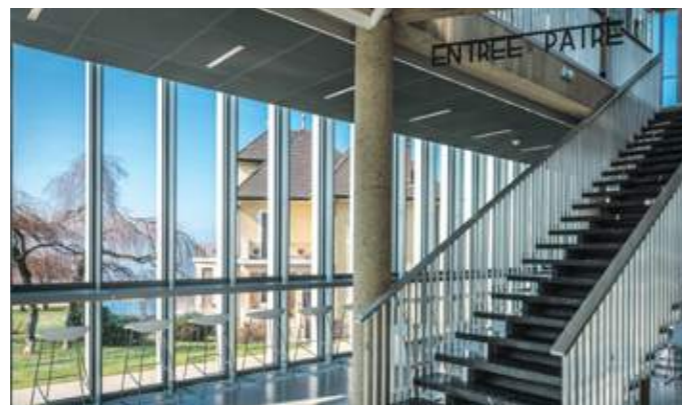
En haut: vue depuis la ville moderne. En bas: promenoir et vue sur le lac.