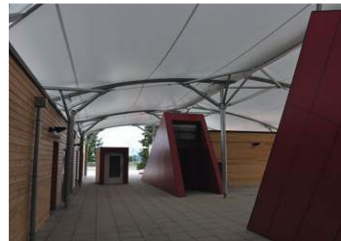
En haut: le nouveau collège, en plusieurs volumes, est construit en mur à ossature bois bardé de zinc. En bas: l'entrée du self est protégée par un préau métal-textile.