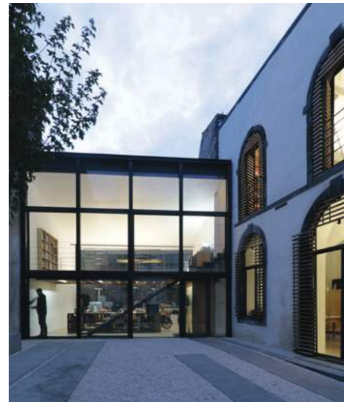
La façade volontairement épurée du bâtiment neuf limite l'impact visuel vis-à-vis de l'existant.