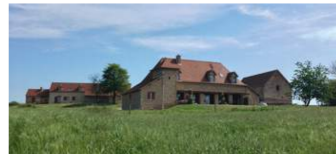
En haut et en bas : façade sud de la grange et ses terrasses.