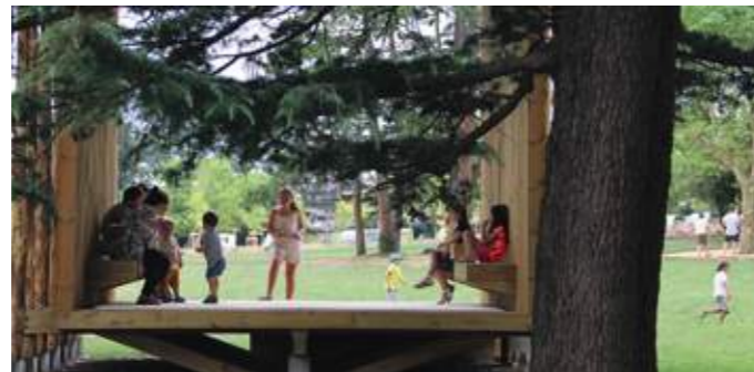
En haut : entretien raisonné et différencié des cheminements. En bas : refuge et espace de jeux au quotidien.