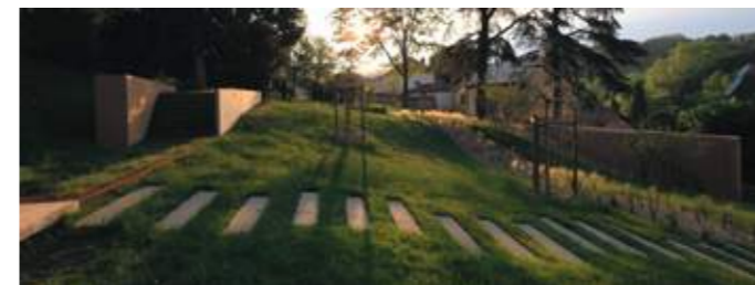
En haut : le « passage inférieur » menant au « jardin ondulant ». En bas : « les passages » reliant l'ancien verger au « jardin ondulant ».

© Jonathan Letoubon © BIGBANG Paysage Urbanisme Architecture