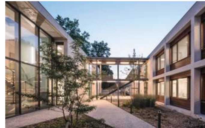
En haut : vue de l'entrée sud. En bas : vue du patio depuis la rue intérieure est.