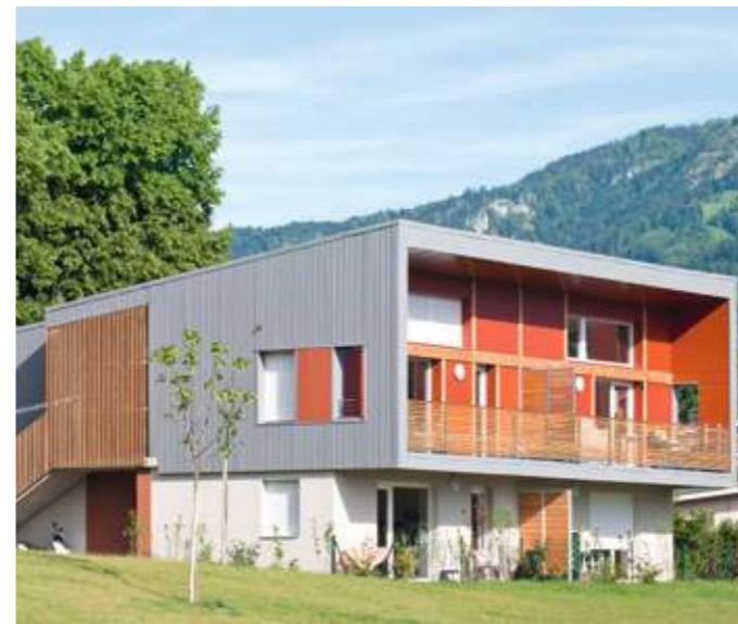
En haut : vue du projet dans le grand paysage. En bas : vue de la façade principale d'un plot.