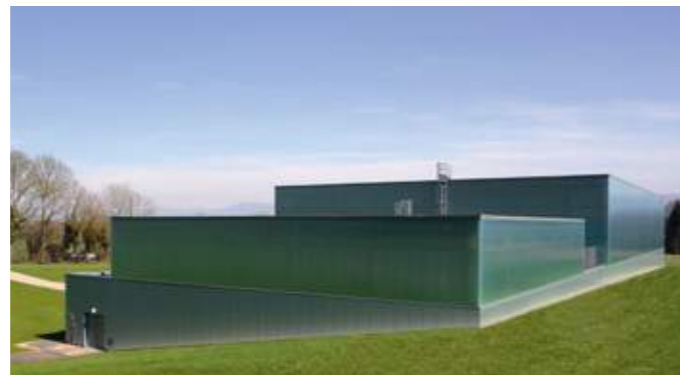
En haut: volumes d'une pure clarté. En bas: le complexe est inscrit dans la pente.