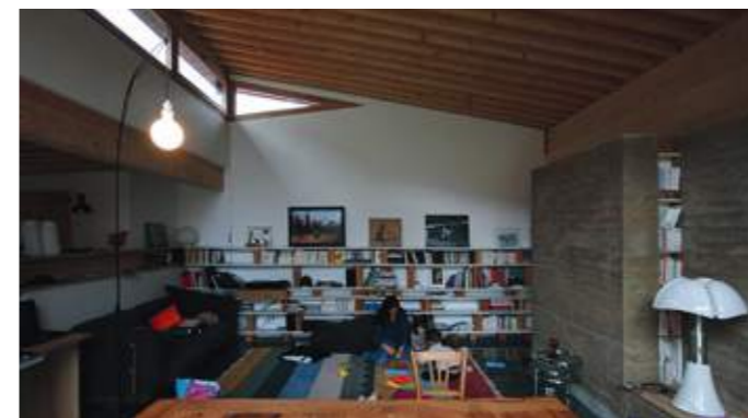
En haut : face au jardin, l'extension sur un plan en L a été conçue en bois. Au milieu : les toitures végétalisées améliorent le confort thermique. En bas : les intérieurs sobres et fonctionnels.

Cette réalisation originale résulte du coup de cœur de quatre familles pour une vaste parcelle et sa maison monofamiliale, typique années 30, au cœur de la métropole grenobloise. Projet intergénérationnel, extension à ossature bois local et toiture végétalisée, hautes performances environnementale et énergétique, espaces partagés viennent consolider la maison originelle réhabilitée, faisant la démonstration qu'une conception d'ensemble permet de concilier intimité, proximité et cadre de vie exceptionnel. Un bel exemple de renouvellement urbain d'un tissu pavillonnaire en concertation avec les riverains et la collectivité.