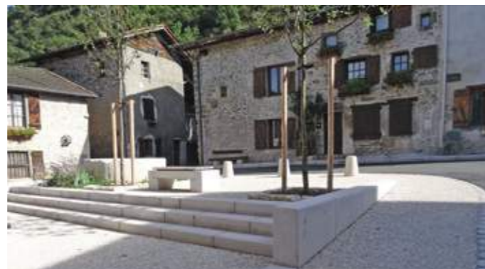
En haut : place de la Fontaine, vue dans l'axe de la promenade piétonne menant vers le haut-village. En bas : placette du haut-village, que le report du stationnement en aval a permis de libérer au profit des piétons.