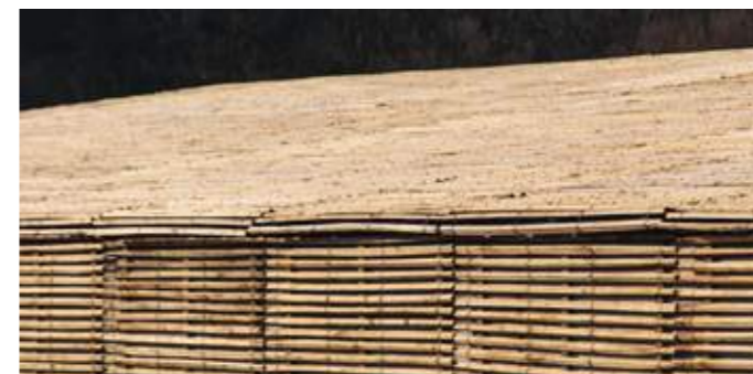
En haut: vue depuis la route d'accès en surplomb. En bas: détail du revêtement de ganivelles de châtaigner.