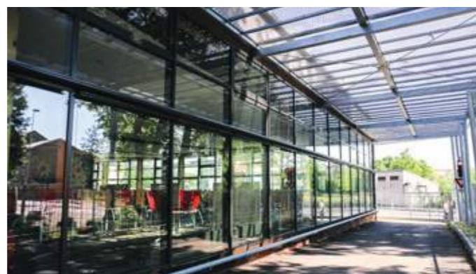
Ombrière protégeant la façade, largement vitrée et ouverte sur la ville et le parc.