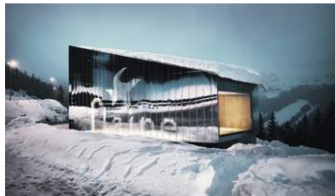
En haut : façade principale du pavillon d'accueil. En bas : la façade nord avec le logo de Flaine.