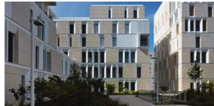
En haut : vue depuis la rue Denuzière vers la place Camille-Georges. En bas : vue du jardin suspendu en cœur d'îlot.