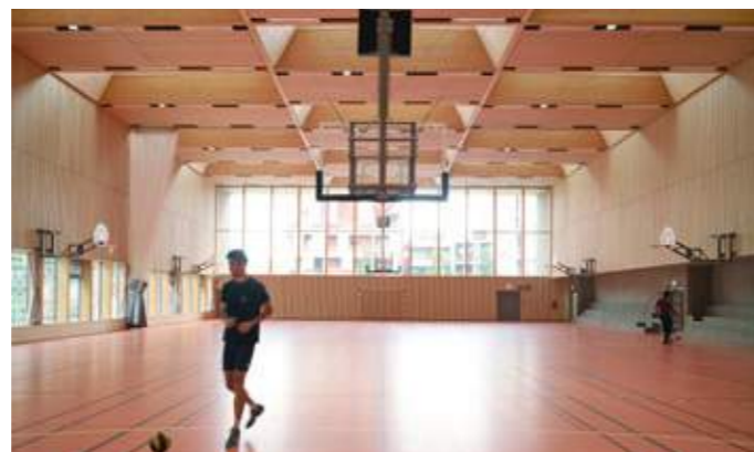
En haut: par son échelle et sa loggia, le gymnase contribue à la création d'une centralité de quartier. En bas: la toiture donne à la salle multisports toute sa noblesse, grâce à un plancher-caisson bois sculpté.