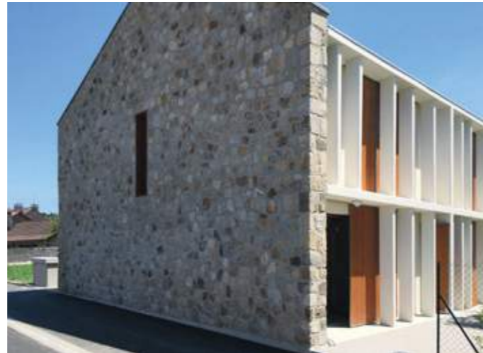
En haut : la façade nord avec les entrées des logements. En bas : pignon ouest en pierre.