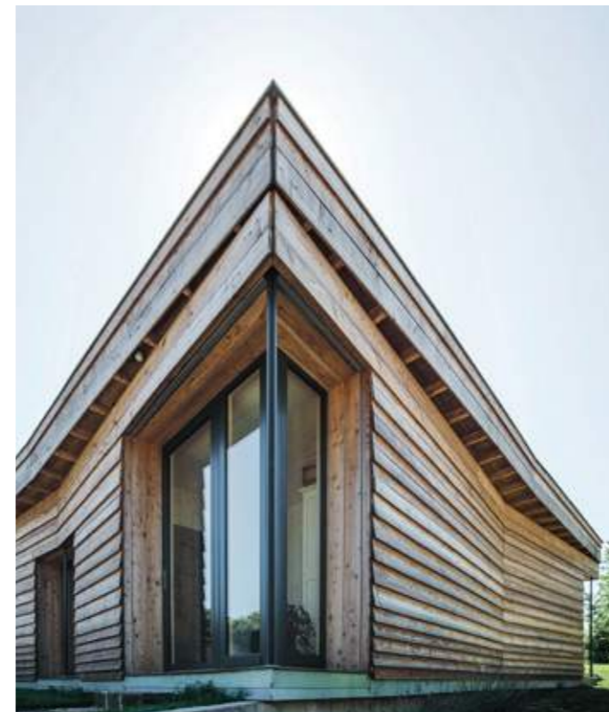
En haut : la façade sud et le jardin. En bas : le débord de toiture fait brise-soleil là où cela est nécessaire.

La Maison P(c)ap(l)ill(ss)on, par sa forme compacte, forte et mesurée, se saisit des qualités de cet ancien verger pour en renouveler le sens. Mimant la bâtisse ancienne de front de rue, sa façade nord-est est implantée à quelques centimètres du mur de brique de l'ancien cloître, conservé. Le projet répond ainsi au programme du maître d'ouvrage, qui, pour sa résidence principale, souhaitait une immédiate relation à ce jardin depuis toutes les pièces de la maison, une discrétion absolue vis-à-vis du voisinage, et, surtout, une construction vertueuse et performante, avec peu de moyens.