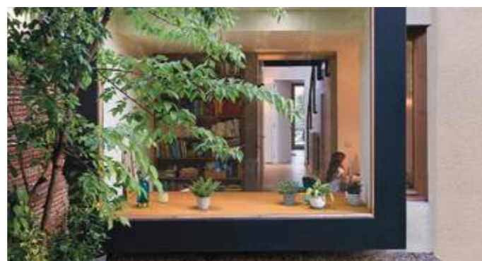
En haut : l'extension depuis le jardin. En bas gauche : un couloir animé, une montée d'escalier éclairée. En bas droite : le bureau en porte-à-faux.