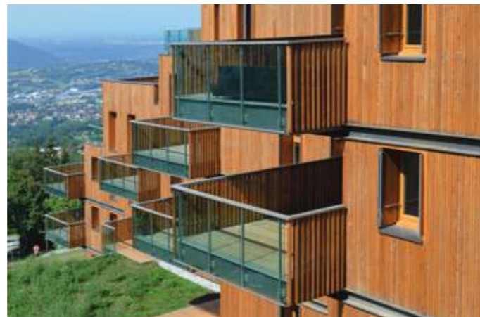
En haut : façade sud-ouest. En bas : vue sur le grand paysage.

© Richard Plottier Architectes Urbanistes Associés