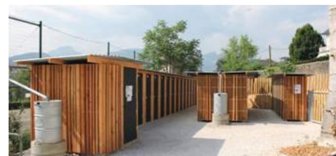
En haut : en plein cœur de Chambéry, ces jardins sont un lieu de production et de rencontre, ainsi qu'un refuge pour la biodiversité. En bas : les casiers sur mesure dédiés à chaque jardinier.