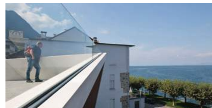
En haut : le belvédère, l'abri et l'escalier d'accès à la promenade du quai André Chevalet. En bas : la proue du belvédère, depuis l'amorce de l'escalier d'accès à la promenade des quais.