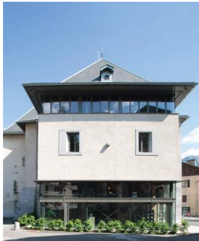
En haut : la façade principale. En bas : la façade nord-ouest.