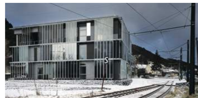
En haut: vue sur l'entrée et la grande salle au premier plan. En bas: passage des voies de chemin de fer le long du bâtiment.