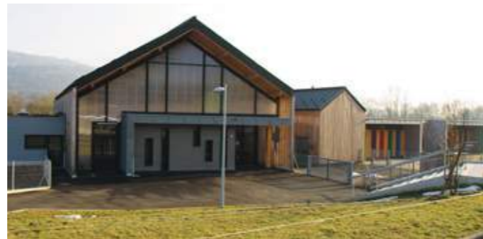
En haut : la façade en clins ajourés permet la ventilation naturelle de la grande halle centrale. En bas : vue depuis le parvis.