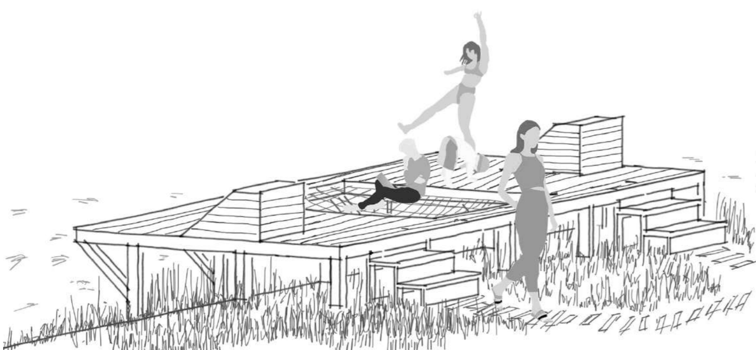
structure 3 : le filet