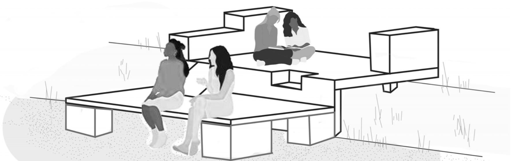
structure 1 : le ponton