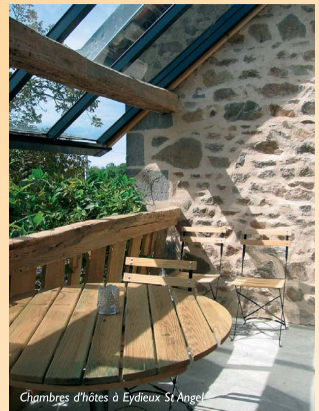
Chambres d'hôtes à Eydieux St Angel