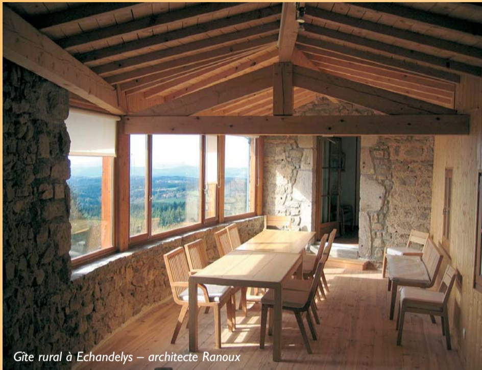
Gîte rural à Echandelys – architecte Ranoux

Cet article s'inscrit dans le cadre de la contribution du CAUE 63 pour la formation « Développement Durable des Territoires, vers une recherche de cohérence et de meilleure qualité des hébergements touristiques » organisée par la formation interrégionale Auvergne, Centre, Midi-Pyrénées, proposé par le CAUE du Loiret, avec les CAUE du Cher et de l'Indre, de l'Allier, du Cantal, du Puy-de-Dôme, du Gers et du Lot.