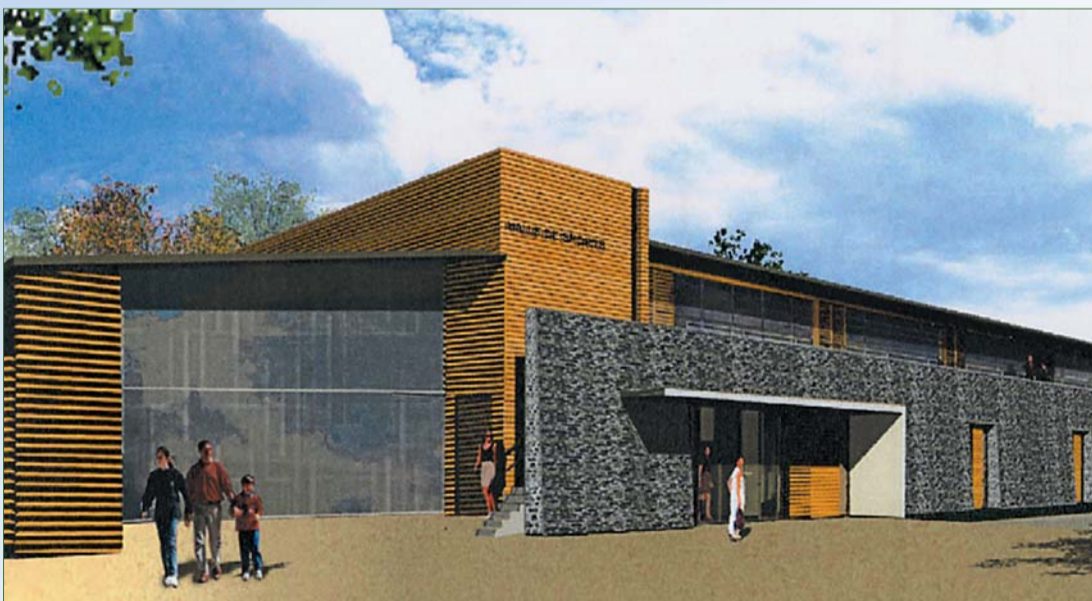
Vue côté chemin départemental.

La zone du plan d'eau de La Tour-d'Auvergne est naturellement devenue le site d'implantation de ce nouvel équipement d'importance pour Sancy Artense Communauté.